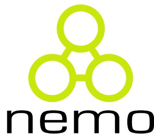
Figura 1 – Exemplo de figura: logo do Nemo.

1 \begin{figure} 2 \centering 3 \includegraphics[width=.25\textwidth]{figuras/fig-intro-nemologo} 4 \caption{Exemplo de figura: logo do Nemo.} 5 \label{fig-intro-nemologo} 6 \end{figure} 7 8 \begin{sidewaysfigure} 9 \centering 10 \includegraphics[width=\textwidth]{figuras/fig-intro-exemplosideways} 11 \caption{Exemplo de figura em modo paisagem: um modelo de objetivos~\cite{souza- mylopoulos:spel3}.} 12 \label{fig-intro-exemplosideways} 13 \end{sidewaysfigure}